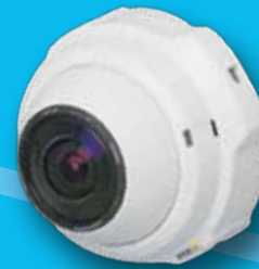
Weitwinkel-Kamera ca. 50m2 Abdeckung